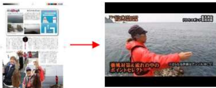
誌面とDVD動画を完全連動！読者の理解を助けます！