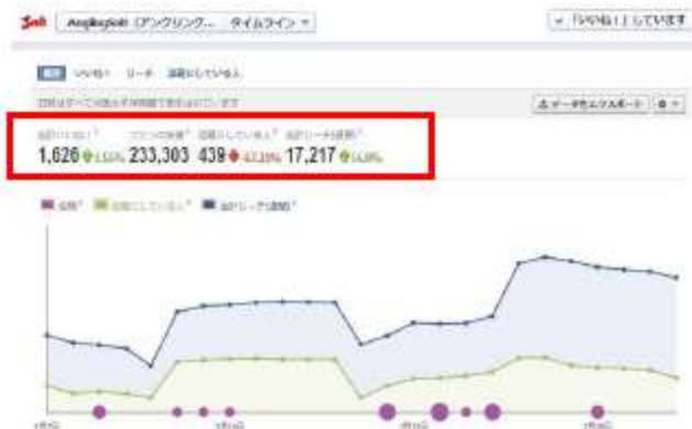
フェイスブックページもファン数、アクセス数増加中！

毎月10数本の誌面連動動画(合計で約120分)を YOUTUBE にアップ。月間30~50万アクセスのYOUTUBE連動動画、ならびに「いいね」数が急上昇中の AnglingSaltフェイスブックページ をフル活用して、媒体認知度を今後さらに高めていきます。